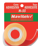
Presentación con Despachador 18 mm X 20 m

Nota: Para colores y medidas especiales, por favor póngase en contacto con nuestro agente de ventas.